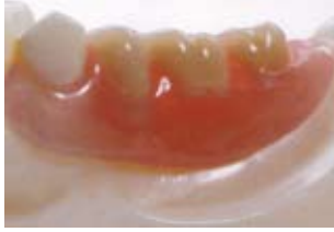
ルヒトンデンチャー

特徴 従来の入れ歯は固定するためのバネがついており、残った周りの歯に負担をかけていましたが、ノンクラスプデンチャーならしっかり噛めて、残っている歯の健康も維持します。また、見た目の違和感が大幅に軽減されます。